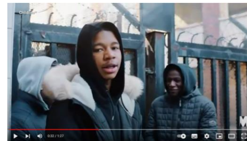
Childline launches its 'Understand Me' anti-racism campaign

Kampania zwracająca uwagę na problem poprawiania wyglądu przez nastolatki