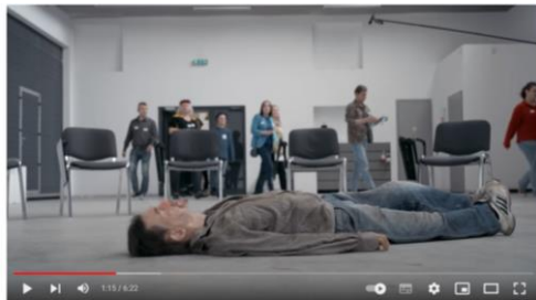
Pierwsza Pomoc Ludzkości | First Aid for Humanity